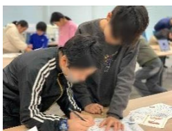
今日だけ特別最強タッグ! 2人合わされば文殊以上!